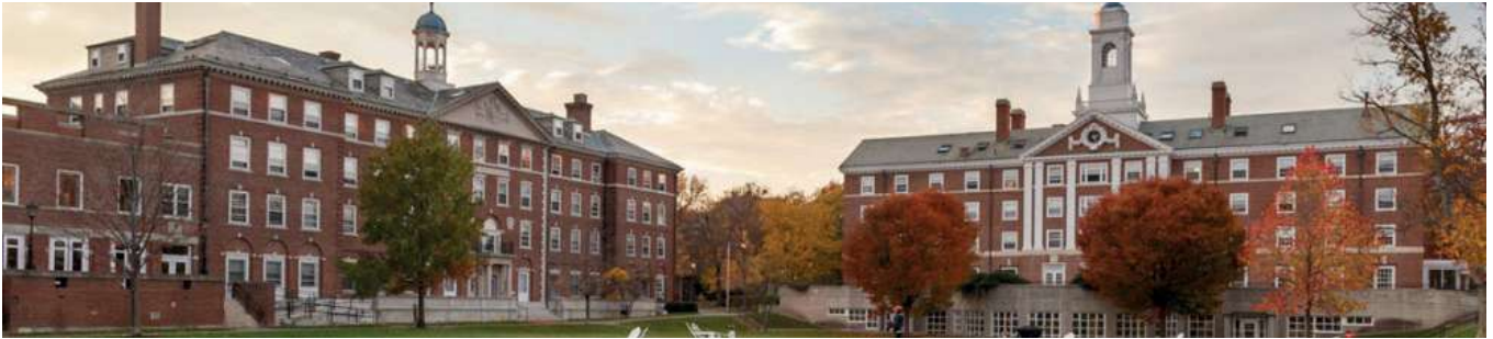
Instituto para Estratégia e Competitividade da Universidade de Harvard (Boston/Massachusetts-USA)

O programa MOC - Microeconomia da Competitividade, em parceria com a UNIALFA, tem como objetivo realizar estudos sobre a competência empresarial e competitiva de "clusters" de negócios na região Centro-Oeste, visando o desenvolvimento de pesquisas acadêmicas e casos para ensino. Faz parte de acordo da UNIALFA com o Instituto para Estratégia e Competitividade da Universidade de Harvard (Boston/Massachusetts-USA), liderado pelo professor emérito Michael Porter, cujo objetivo principal é explorar os determinantes da competitividade e do sucesso empresarial numa perspectiva econômica regional. Esta entidade congrega atualmente aproximadamente 100 universidades filiadas no mundo todo, que desenvolvem pesquisas sobre negócios locais, agrupados em "clusters" ou arranjos produtivos locais, utilizando metodologia de análise que considera não somente os fatores tradicionais de produção, como também o grau de exigência da demanda interna, a presença de setores correlatos e de apoio (governo, universidades, institutos de pesquisa), assim como a dinâmica competitiva das empresas existentes.