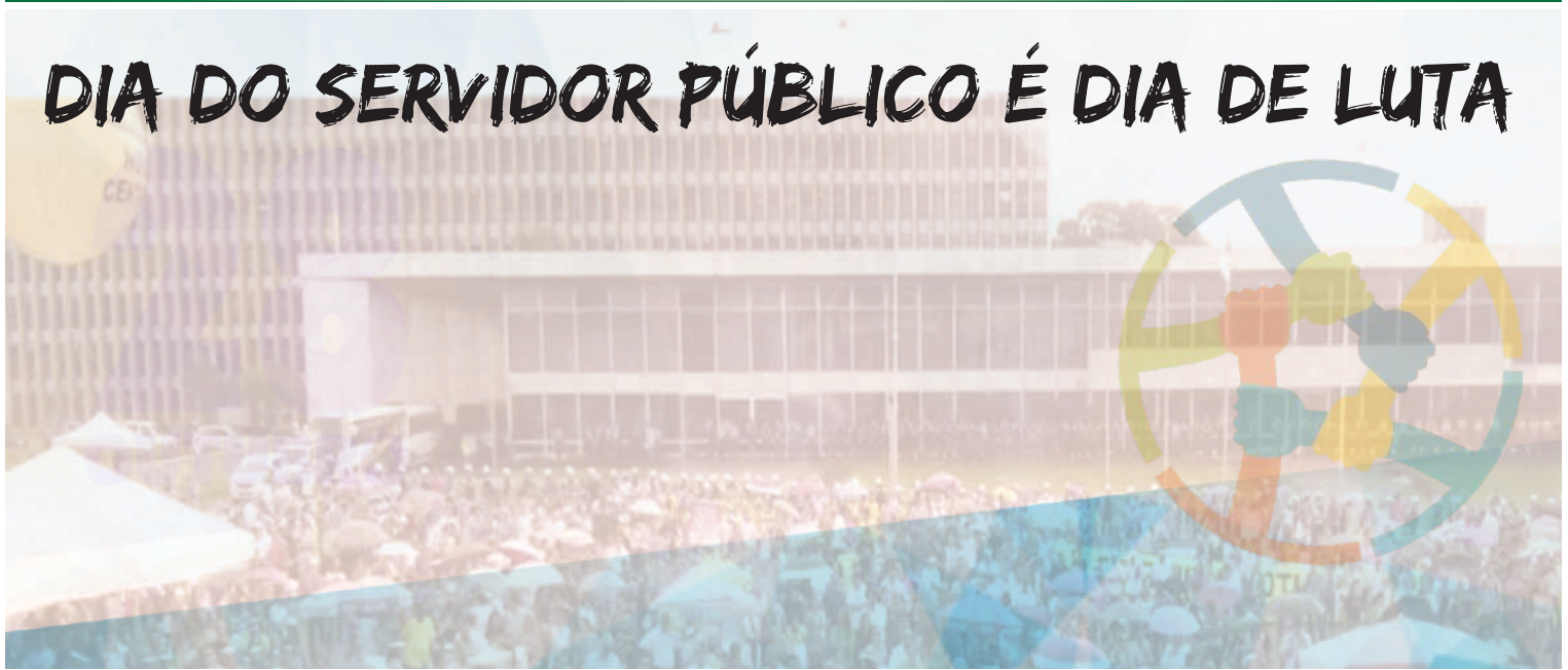
Praça do Palácio do Buriti Brasília-DF

O dia 28 de outubro nunca foi tão significativo. Nosso dia, o dia do servidor público, agora é marcado como um dia de lutas.